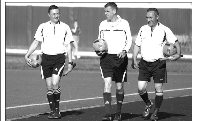
Подготовил Никита КОНЦЕВОЙ.